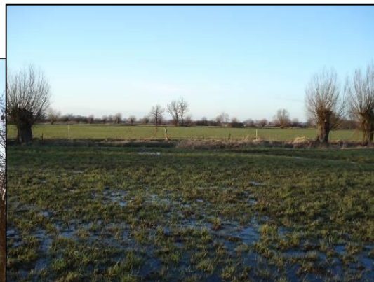
Bilder aus der zukünftigen Trasse