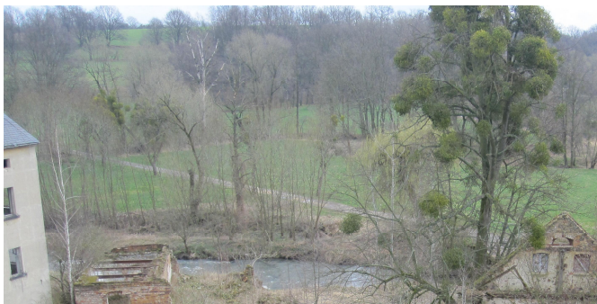
Zu querendes Tal „Löbauer Wasser“ (FFH-Gebiet)