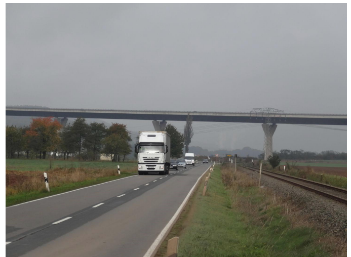
vorhandene L 236 Blickrichtung Norden